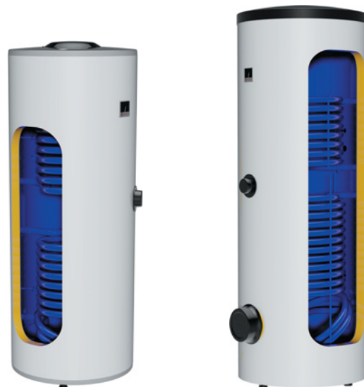
OKC 200, 250 NTRR/SOL OKC 300 NTRR/SOL

Pozn: ** K ohřivači je přiložen pojistný ventil 6 bar.